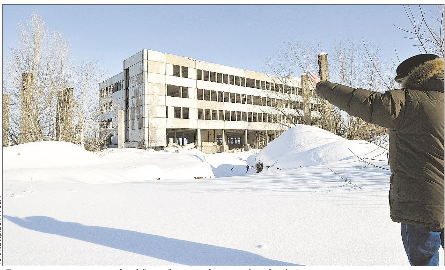
Пустовавшая много лет площадка будет выдавать продукцию на 9 млрд рублей.

Руководство «Витязя», узнав о наличии такого интереса, предложило «Уралвагонзаводу» рассмотреть площадку в Ишимбае. На заводе к тому же имеются свободные мощности для дальнейшей локализации производства.