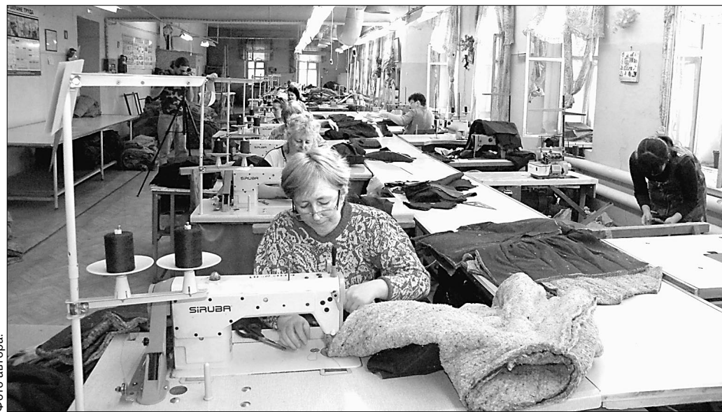
Работники «Дружбы» стараются не отстать от моды.

Больше половины работников стерлитамакской «Дружбы» — инвалиды