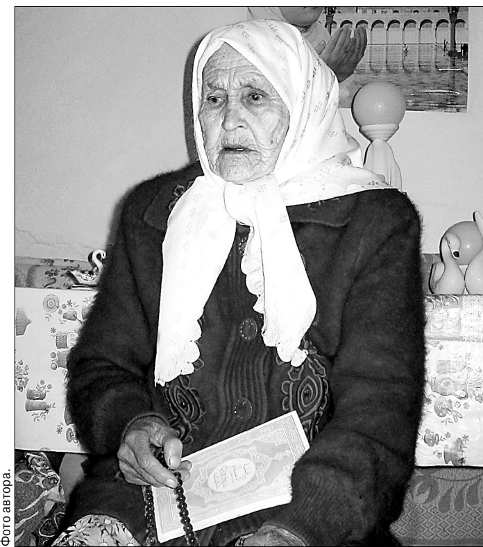
Хасна-апай верит, что спокойно отслужит ребятам помоги ее молитвы.

А ребята тоже, демобилизовавшись, первым делом идут к ней, чтобы поблагодарить и