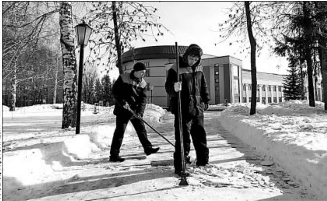
Лед, похоже, тронулся.