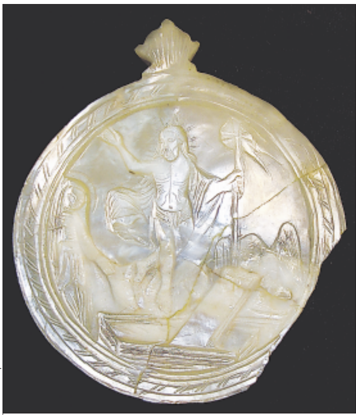
Панагия, принадлежавшая одному из «ночных епископов».

В 1960-е годы, когда страшные сталинские репрессии вроде бы остались позади, начались новые гонения на церковь. В районе Нижегородки прошли внезапные обыски и аресты.