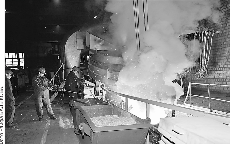
Сделать труд безопасным выгодно самому работодателю.

Одним из важнейших направлений работы Фонда остается страхование профессиональных рисков. На учете по обязательному социальному