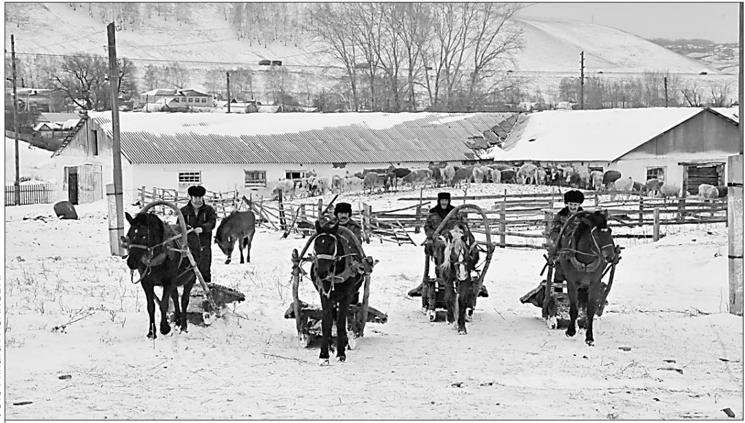
Сегодня село разнoliko — есть хозяйства с импортной техникой, но больше все же таких.