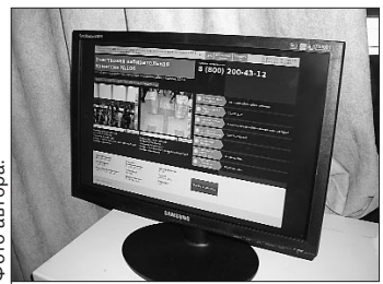
Проконтролировать процесс видеосъемки можно будет непосредственно на избирательном участке.

Из 3 тыс. 509 региональных избирательных участков, по словам председателя республиканского ЦИК, видеонаблюдение уже организовано на 3 тыс. 467. То есть все участки, подлежащие видеоконтролю, технически готовы. Силы специалистов ОАО «Башинформсвязь» на каждом из них были смонтированы по две видеока-