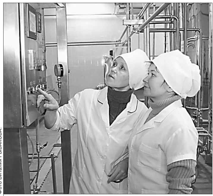
Умная автоматика помогает выпускать качественную продукцию.

«Бакалымолоко» открыло цех по выпуску цельномолочной продукции