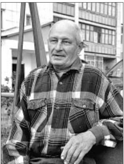
Макаров и товарищи теперь каждую копейку считают.

А вот к тому, что в холодное время года плата за отопление будет довольно приличной, стоит быть готовым заранее. Дело в том, что прежде