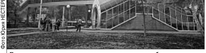
Галерея покрыта самым прочным поликарбонатом.

В Стерлитамаке буднично, без лишней помпы ввели в эксплуатацию пешеходную галерею, соединяющую три стороны бойкого перекрестка на пересечении улиц Вокзальной и Худайбердина.