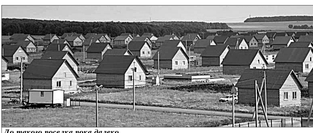
До такого посёлка пока далеко.