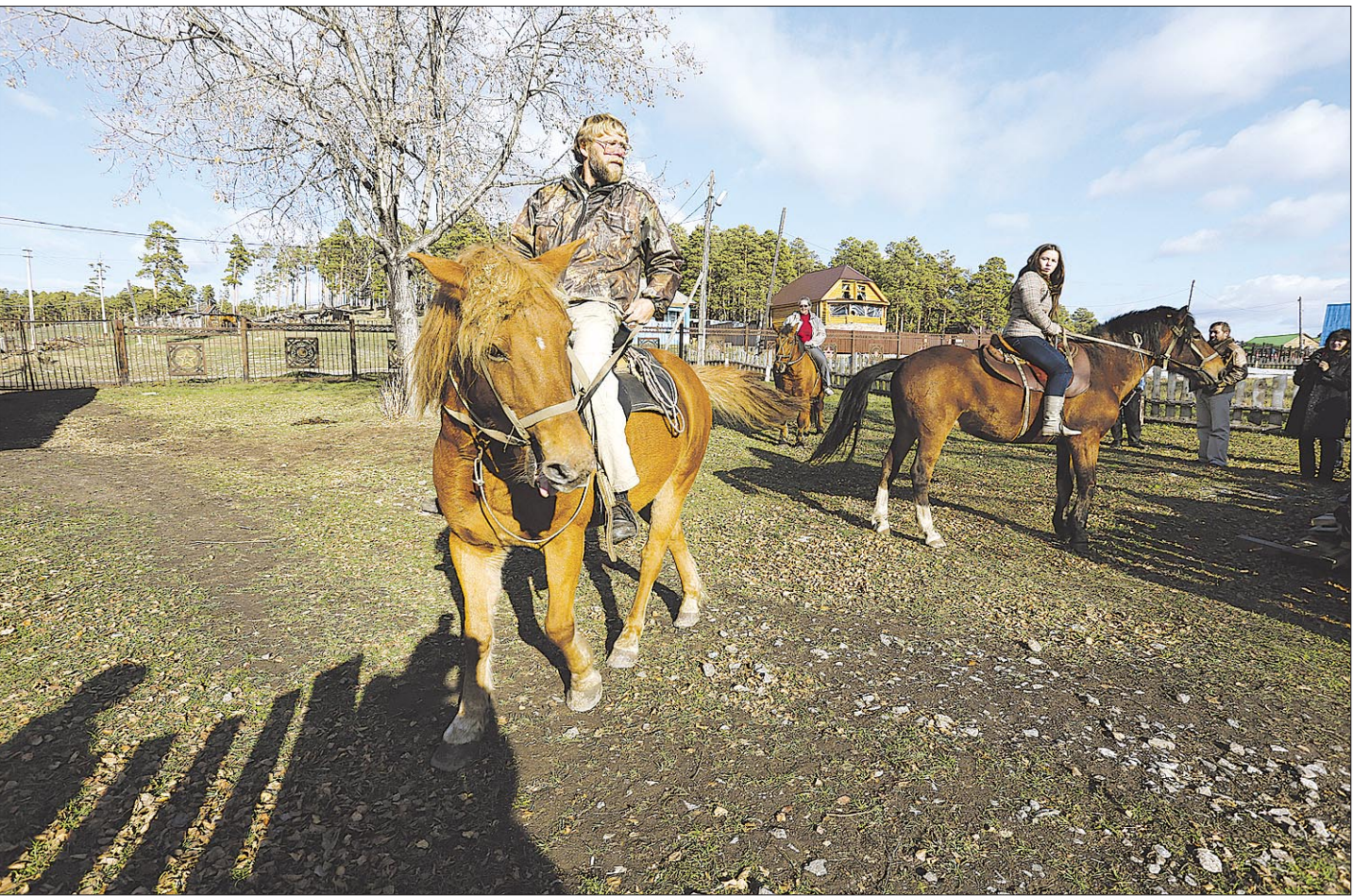
Первый в Башкирии конный маршрут был организован в 1975 году.

— Мы приехали с мужем вчера. Ему дали бесплатную путевку на работе, а мне, как члену семьи, вторая путевка досталась за полцены. До этого мы бывали во многих санаториях, но такого равнодушия, как