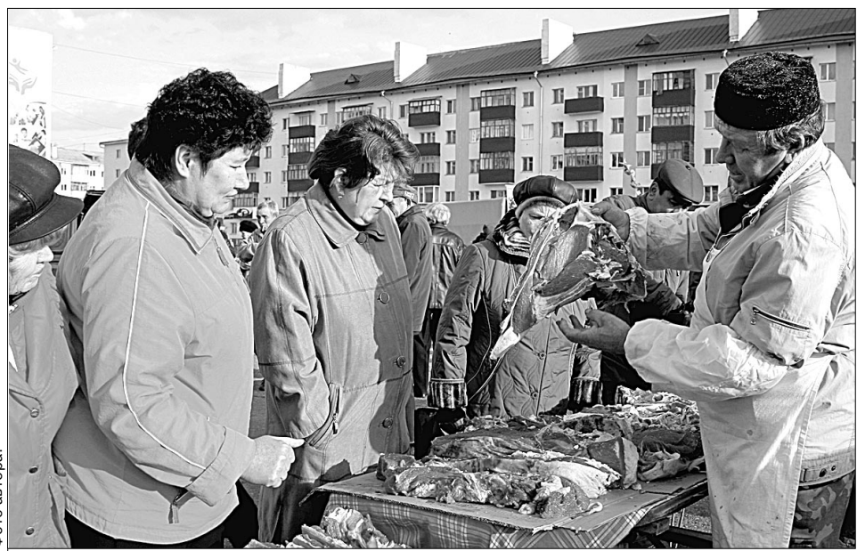
Ярмарочные цены оказались ниже рыночных.

— Эта ярмарка — одна из первых, следующая состоится уже совсем скоро. Так что тем, кто не смог побывать на площади сегодня, унывать не стоит. Все то же самое и по тем же ценам можно будет приобрести еще не раз, — говорит заместитель главы горо-