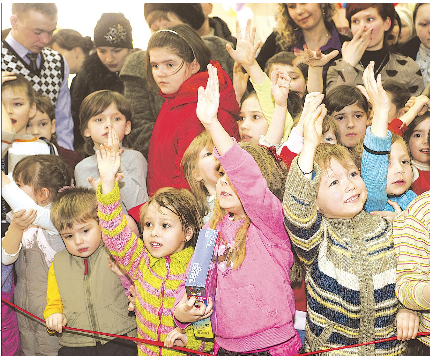
Мы — за детские сады!

Вместе с тем в этом году жилья введено на 11% больше, чем в прошлом. К концу года планируется построить более 2,3 млн кв. метров жилой площади. По общему объему ввода жилья республика на шестом месте в России. А по индивидуальному жилищному строитель-