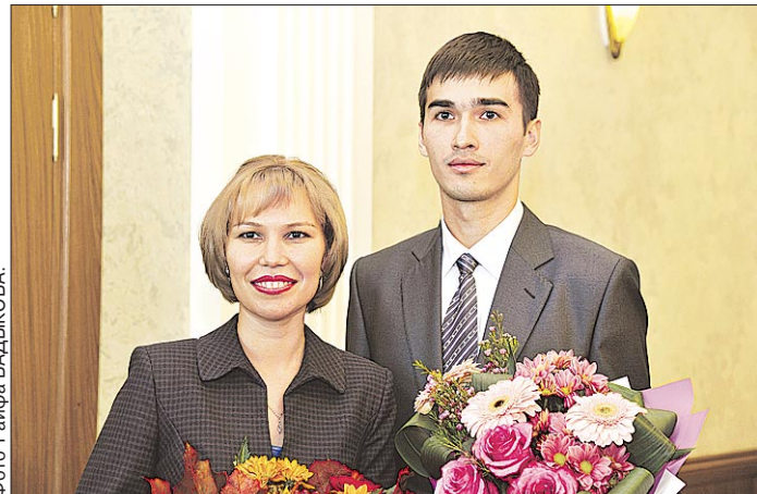
Государственная республиканская премия вручена за нефтехимические разработки.

«Нужны годы, чтобы заработать себе имя, чтобы получить результаты. Я сам вышел из науки и понимаю, что научная деятельность требует кропотливого и повседневного труда», — отметил президент. — При этом неудач больше, чем успехов, что тоже вполне понятно, но это закаляет и волю, и характер, и дает определенную перспективу». По его словам, достижения ученых республики в последние годы стали известны в стране и за ее пределами, а Башкортостан стал местом проведения междуна-