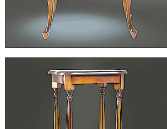
Новинки под маркой «UFAWOOD»: качество, полнота оригинальности.