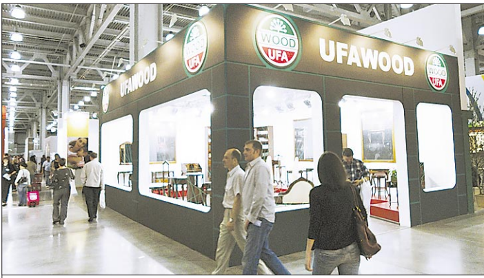
На выставке «ЕвроэкспоМебель-2011».