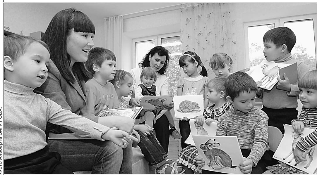
Увлекаясь игрой и творчеством, дети забывают о грустном.