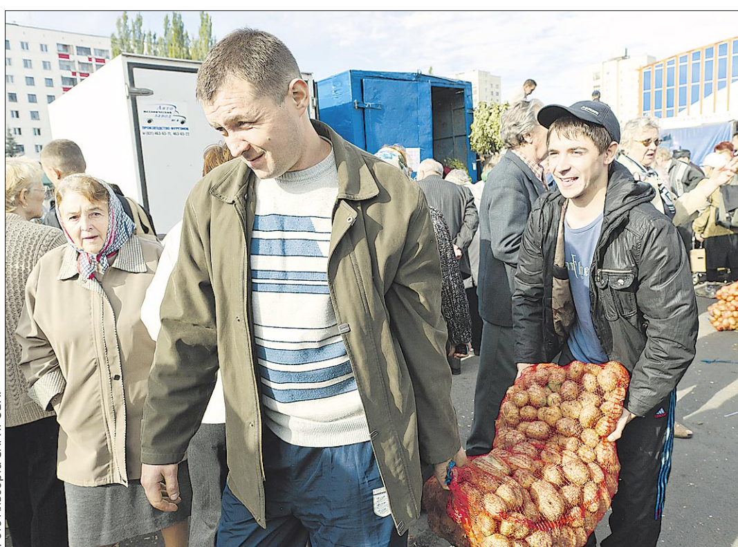
Запас на зиму есть!