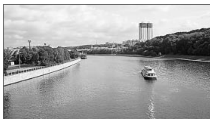
Москва-река в районе Воробьевых гор.

О жизни людей можно судить по результатам их труда. Средняя урожайность значительно выросла по сравнению с довоенным уровнем — более чем в полтора