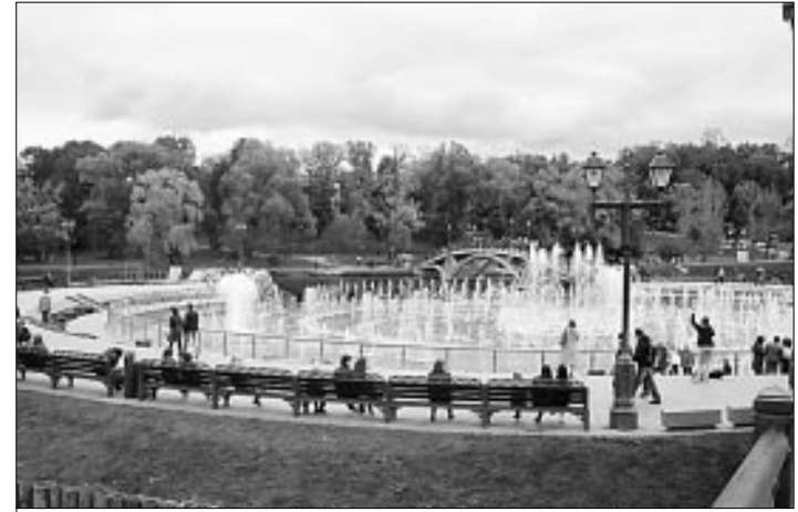
В музее-заповеднике природно-исторического парка «Царицыно».