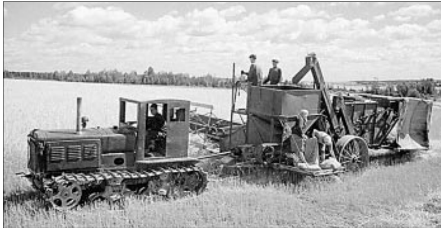
Такая техника в те годы считалась передовой.

С 1952 по 1959 год закупочные госцены на зерно выросли в среднем в 3 раза, а на продукты животноводства — в 5,6 раза. Были введены даже азы хозрасчета: за сверхплановые поставки колхозам платили еще больше. МТС ликвидировали, а их технику передали колхозам и совхозам — правда, за какие-то деньги, за которые они долго потом расплачивались. Но многие долги были прощены государством.