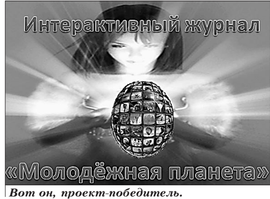
Вот он, проект-победитель.

Жизнь библиотеки не ограничивается малым: выбрал книгу, расписался, убежал. Посетителей