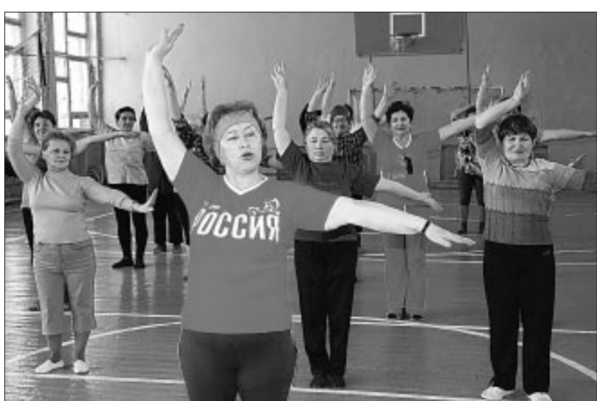
Идут занятия в клубе.

ли, а в Доме техники выделили помещение — бесплатно, все равно оно по большей части пустовало, — вспоминает Батришина. — Пять лет назад это было. Теперь у нас в клубе — без малого шестидесять девушек. Да-да, не улыбайтесь, именно такими мы себя ощущаем. А ведь человеку столько лет, на сколько он себя чувствует. Возраст по паспорту у некоторых давно за семьдесят перевалил, а они еще многим молодым фору дадут. Красота физическая и душевная — вот наша цель. Два раза в неделю, отложив домашние дела, забыв о проблемах, собираются женщины в клуб. Переодеваются, поговарят о том, о сём и... затягивают песню — так начинается каждое занятие. Фитнес и пилатес, дыхательная гимнастика и восточные танцы — все под контролем врачей и специалистов, по самым передовым методикам. Изучают предметы самостоятельно, доставая нужную литературу. Потому что если с врачами проблем нет — их немало среди членов клуба, то профессиональные инструкторы работают только за немалые деньги. Заня-