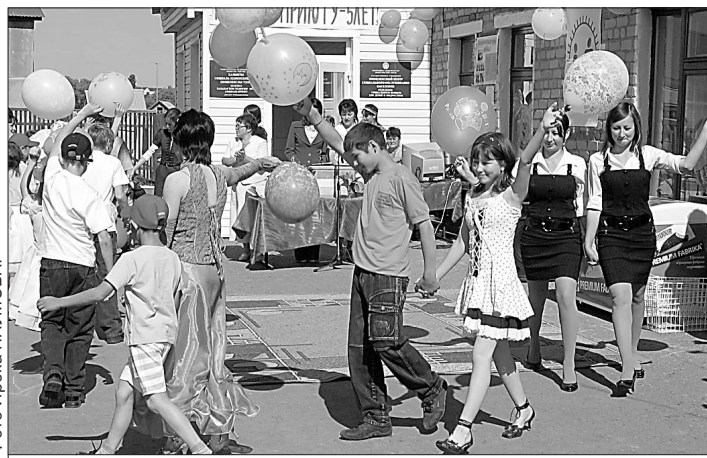
Дети летали не зря: отдыхают весело.

Пять лет в Бижбулякском районе действует социальный приют