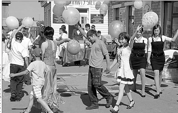
Дети лета ждали не зря: отдыхают весело.

Пять лет в Бижбулякском районе действует социальный приют