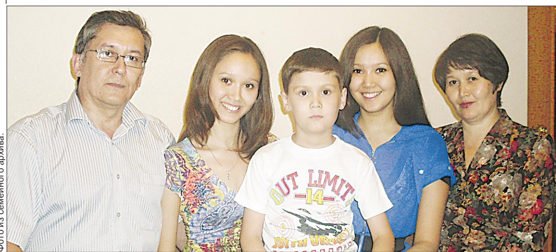
Семья — на загляденье!