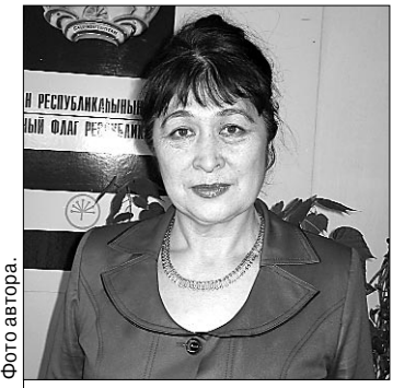
Баймакская школа № 3 славит учителями башкирского языка и литературы.

В списке достижений данной школы важное место занимают победы в различных конкурсах учителей башкирского языка и литературы. По всему видно —