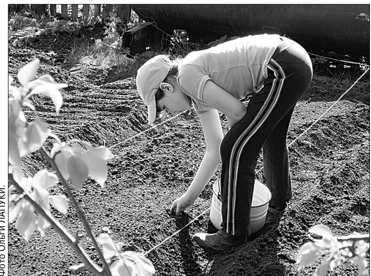
От качества семян зависит будущий урожай.

Вот такие здесь трудятся энтузиасты. Познакомившись с ними, понимаешь: «лицо» школы — это не фасад. Это, в первую очередь, люди, которые здесь работают.