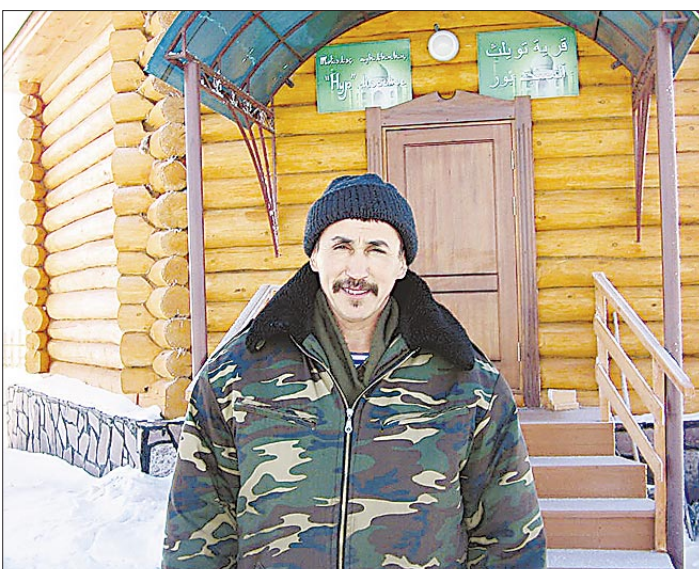
Такой мечети нет во всей округе.

В посёлке Туяляс жизнь изменилась к лучшему