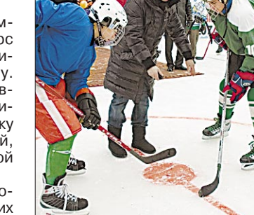
Первое бросание шайбы на новой ледовой площадке произвел Вячеслав Быков.

шланг для заливки, сетку-рабицу для ограждения.