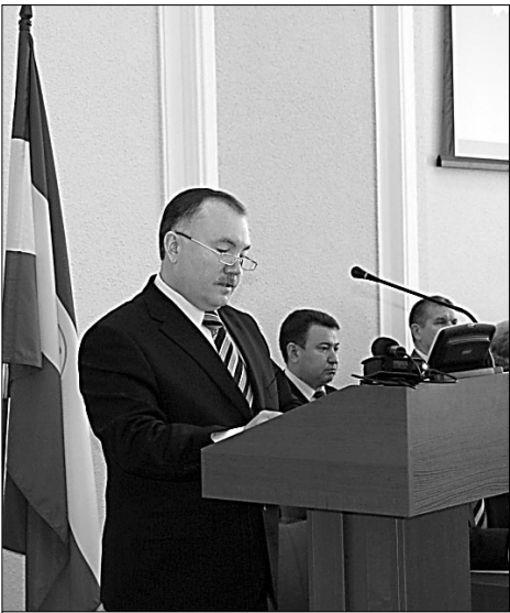
Председатель КСП РБ С. Ф. Харасов.

На деле неэффективное использование выглядит таким образом: объекты нежилого фонда и земельные участки используются без заключения договоров аренды (неужели бесплатно?) либо арендная плата занижается. Кроме того, юридические и физические лица занимают большие площади без документального оформления прав пользования госимуществом. Конечно, выявление нарушителей — важная задача. Но главное все-таки возмещение государственного ущерба, — заострил внимание сотрудников палаты Салават Фаттахович. — Из вышеупомянутых 650,9 миллиона рублей на возврат и восстановление поставлено лишь тринадцать