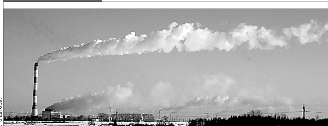
Дымящие трубы — примета работающих заводов Стерлитамака.