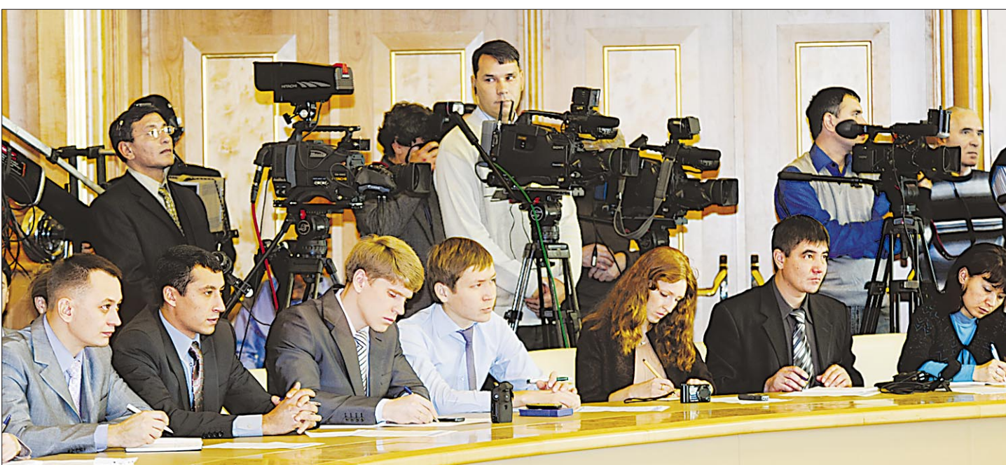
У журналистов было много вопросов, которые они задали президенту.