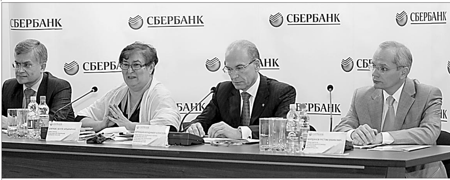
На семинаре «Сбербанк России — брокерское обслуживание» — заместитель Премьер-министра Правительства Республики Башкортостан — министр финансов Айрат Гаскаров, заместитель председателя правления Сбербанка России Белла Златкис, председатель Уральского банка Сбербанка России Владимир Черкашин, председатель Национального банка Республики Башкортостан Рустэм Марданов.