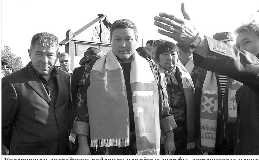
Участникам экспедиции подарили нарядные шарфы, украшенные национальными орнаментами.

Республика встречала участников Международной научно-исследовательской караванной экспедиции «По следам Великого шёлкового пути»