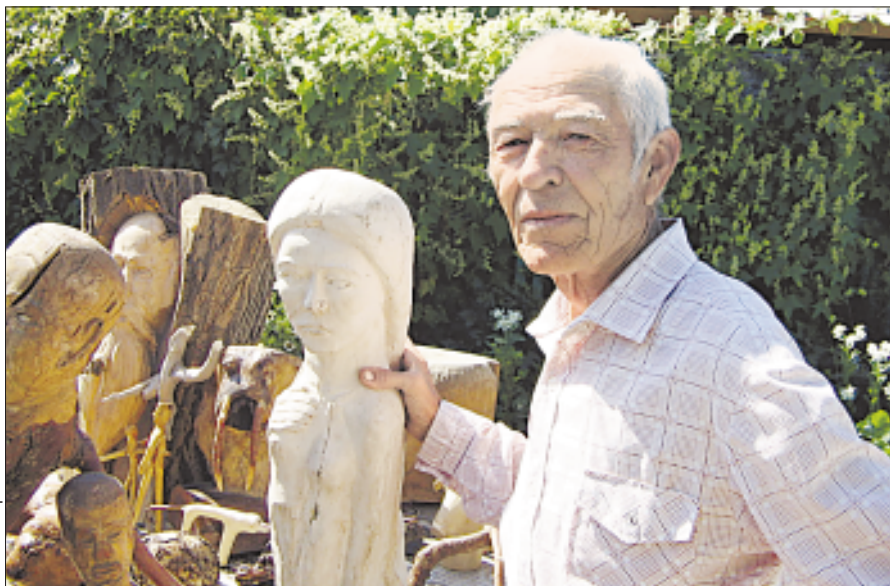
В компании лесных скульптур художнику не скучно.