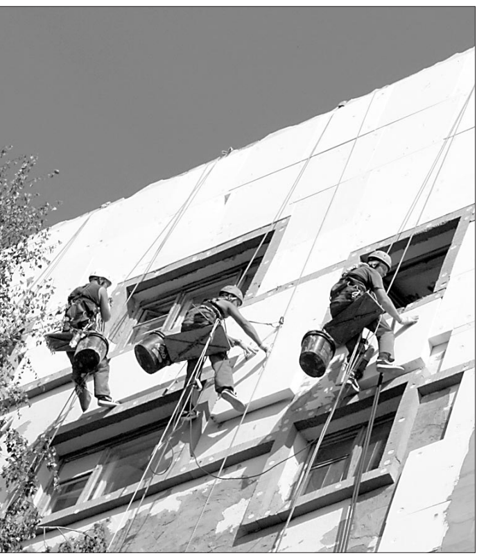
Как дела наверху?