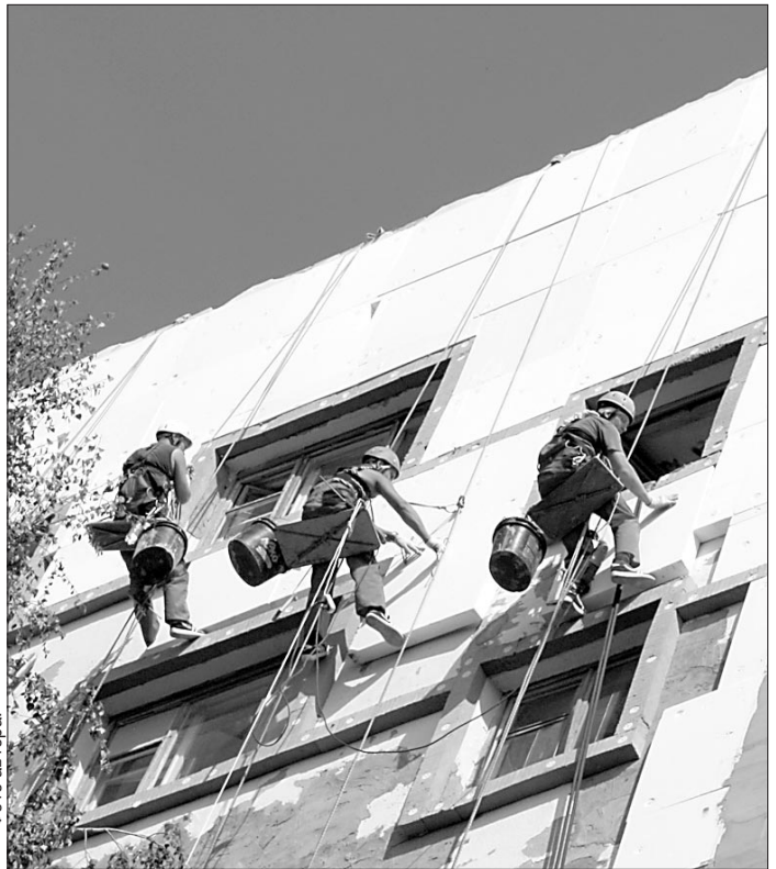
Как дела наверху?