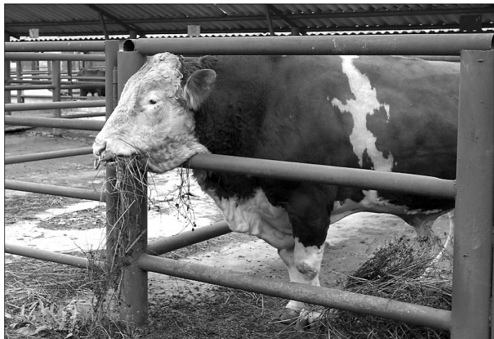
Банзай к гостям давно привык.

Акциионерное общество «Башкирское» — централизованное хозяйство. Его основная задача — получение от высокопродуктивных племенных быков (они завозятся в республику из Голландии, Франции, Австрии, Англии, Германии, Канады) спермы для искусственного осеменения маточного поголовья. В лаборатории предприятия она фасуется, подвергается глубокой заморозке, а затем поставляется в хозяйства республики. При этом используется высокоэффективная технология криоконсервации спермы, получившая название «Уфимская» и разработанная здесьими специалистами. Кстати, это единственная в России запатентованная технология. В нее вошли уникальные изобретения и разработки специалистов лампредприятия, направленные на максимальное сохранение биологических, генетических достоинств и оплодотворяющих свойств спермы быков-производителей. Оборудование и приборы, которые при этом используются, создают максимум удобства в работе. Чего нельзя сказать о французской, немецкой или литовской технологиях, которые в несколько раз дороже и не совсем удобны. Например, применяя французскую технологию, нужно долгое время находиться в помещениях с низкой темпера-