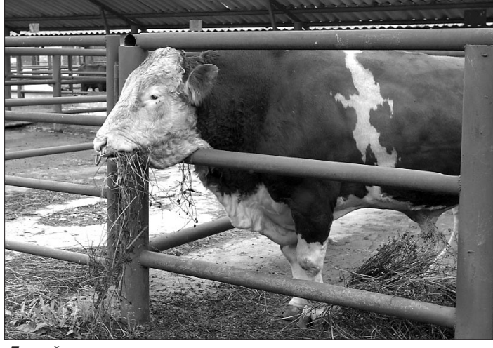
Банзай к гостям давно привык.

Акционерное общество «Башкирское» — централизованное хозяйство. Его основная задача — получение от высокопродуктивных племенных быков (они завозятся в республику из Голландии, Франции, Австрии, Англии, Германии, Канады) спермы для искусственного осеменения маточного поголовья. В лаборатории предприятия она фасуется, подвергается глубокой заморозке, а затем поставляется в хозяйства республики. При этом используется высокоэффективная технология криоконсервации спермы, получившая название «Уфимская» и разработанная здесьими специалистами. Кстати, это единственная в России запатентованная технология. В нее вошли уникальные изобретения и разработки специалистов племенного хозяйства, направленные на максимальное сохранение биологических, генетических достоинств и оплодотворяющих свойств спермы быков-производителей. Оборудование и приборы, которые при этом используются, создают максимум удобства в работе. Чего нельзя сказать о французской, немецкой или литовской технологиях, которые в несколько раз дороже и не совсем удобны. Например, применяя французскую технологию, нужно долгое время находиться в помещениях с низкой темпера-