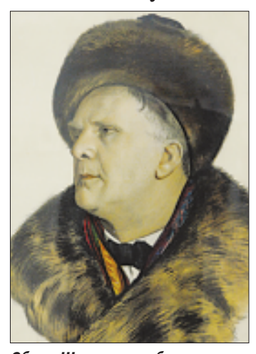
Образ Шаляпина работы несравненного Кустодиева в Уфе пользуется особенной любовью.

Как рассказал один из организаторов Александр Ежов, Центральная художественная галерея столь грандиозную идею вынашивала давно. Ведь что ни говори, подобное заведение жизнеспособно лишь при условии активной выставочной деятельности. Хотя столь значимая экспозиция появилась здесь впервые, судя по количеству посетителей в обычно негромких залах и восторженных откликах в книге отзывов, уже сейчас можно сказать, что проект удался.