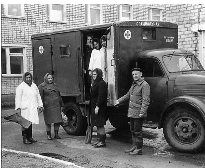
Выезд дезстанции на объект заражения, 1965 год.

В настоящее время основные организационные и практические мероприятия направлены на реализацию приоритетного национального проекта «Здоровье» в области дополнительной иммунизации населения, профилактики и лечения ВИЧ-инфекции, гепатитов В и С. Против гепатита В охвачено первой вакцинацией 330978 человек, второй — 37434 человека; против крас-