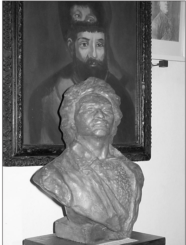
Экспозиция в музее истории Оренбурга.

...Дорожный указатель сообщает: от Салавата до Оренбурга 220 километров. Наша «Волга» миновала Мелеуз, приближается к селу Ира близ Кумертау. Взгляд привлекает церковь Покрова Божьей Матери. Кирпичная. С куполами и приделом или яны Веры, Надежды, Любви и матери их Софии. Местные прихожане говорят, что первоначально церковь была деревянной, построенной по указу Екатерины II, когда ца-