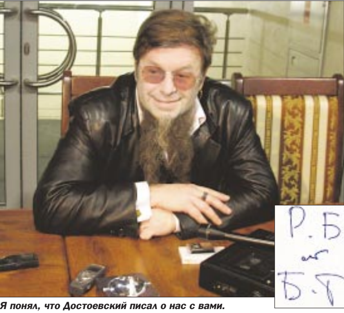
Он понял, что Достоевский писал о нас с вами.

— Конечно, нет. Просто звездам принято задавать такие вопросы.