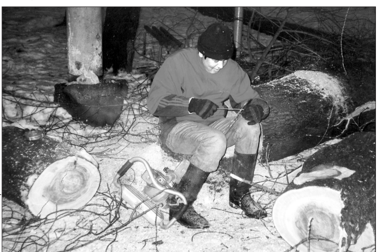
«Зеленый щит» вдоль проспекта Октября в Уфе нуждается в обновлении.

Воспоминание многолетней давности. Родители после размена с младшей дочерью, моей сестричкой, въехали в двухкомнатную «хрущевку».