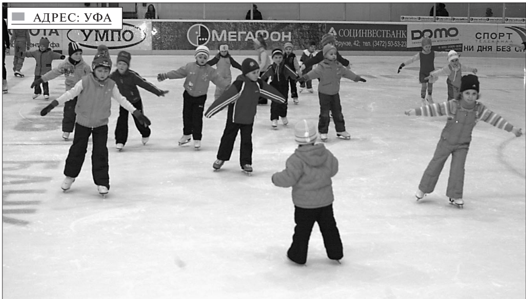
Мы скоро вырастем и всех удивим.