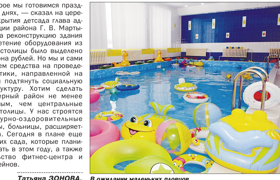
В ожидании маленьких пловцов.