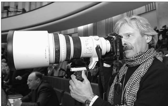
Фоторепортеры смотрели за Президентом в оба глаза.

выключить сотовые телефоны. Ответственная, вроде бы, минута, но зал вдруг вздрогнул от хохота — свои мобильники все сдали в специальные камеры хранения еще на этапе проверки.