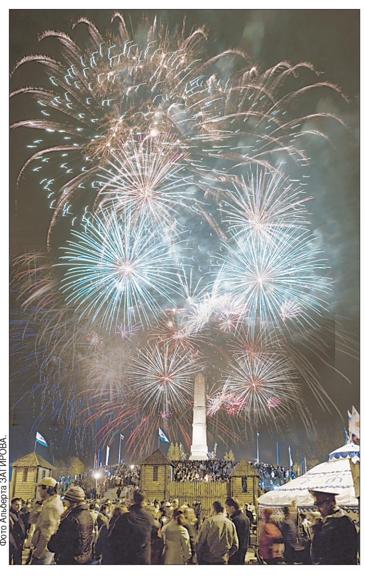
Окончание на 2-й стр.

В дни празднования 450-летия добровольного вхождения Башкортостана в состав России, как, впрочем, и всегда в дни больших праздников, главную площадь города, площадь имени Ленина, заполнил отдыхающий народ. Здесь есть все, чтобы отметить столь значимую дату с беззаботным настроением и всецелью без оглядки: есть где перекусить, есть подо что потанцевать и что послушать. И так сухо и хрустко шуршат под ногами опадающие листья старого парка, кружась в воздухе беспечным хороводом, и так терпко пахнет нагретой последним солнцем корой отходящих деревьев и уже стоптанной в плотный ковер золотистой уснувшей травой. А главное, день выдался солнечным и по-настоящему праздничным, и рядом друзья, поэтому и название: «Мы вместе!» звучит как нельзя более актуально.