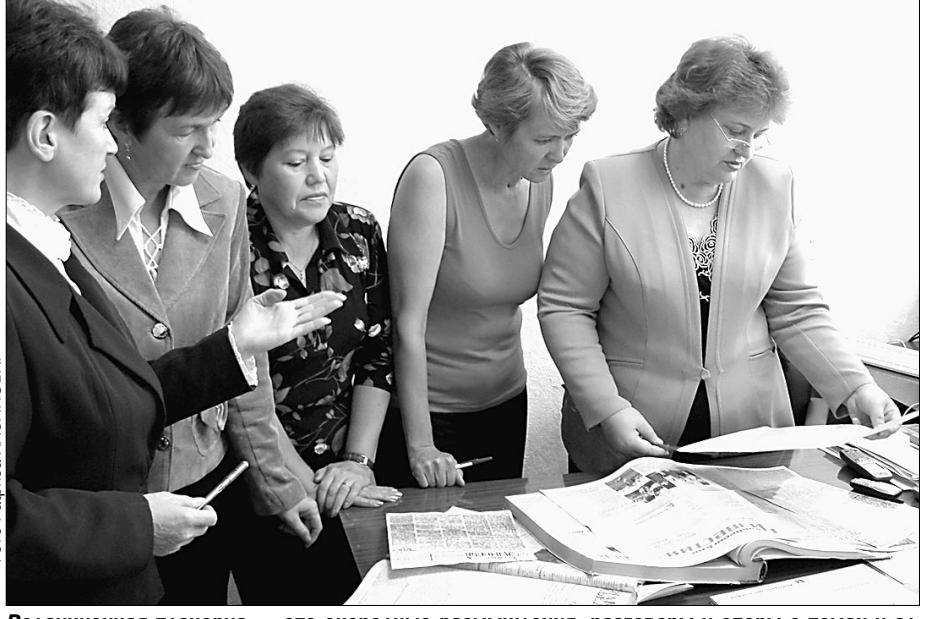
Редакционная планерка — это очередные размышления, разговоры и споры о темах и адресатах будущих публикаций.