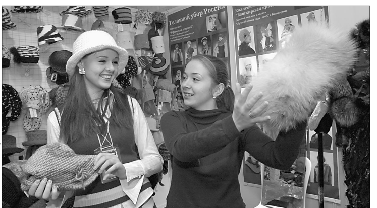
Такие шапки придутся по вкусу любой моднице.