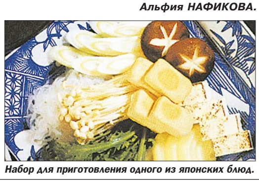
Набор для приготовления одного из японских блюд.

Рекомендует Всеволод Овчинников и несколько излюбленных рецептов, уже опробованных в домашних условиях. Предлагаем вниманию наших читателей один из них. Может, кому-то эти китайские пельмени придутся по вкусу.