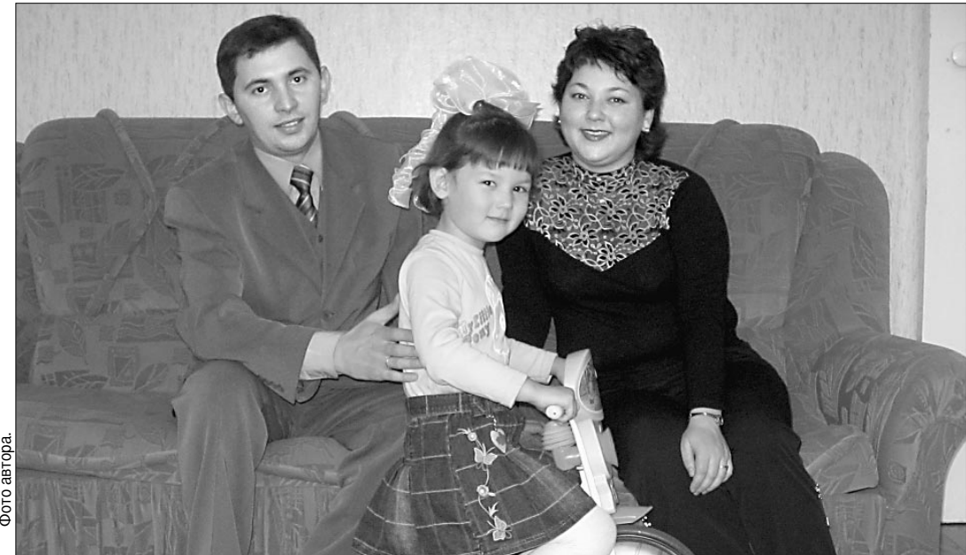
Десять дней из дома не выходили — не могли налюбоваться на свое жилище.