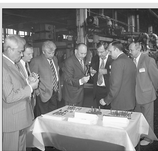
В рамках заседания ПКК.

воду грозила потеря лидирующих позиций в отрасли. Судьба «Автономали» вызвала серьезную озабоченность и у руководства республики. Вскоре с помощью нам удалось установить деловые контакты с группой компании «СОК» — мощного потенциального инвестора.