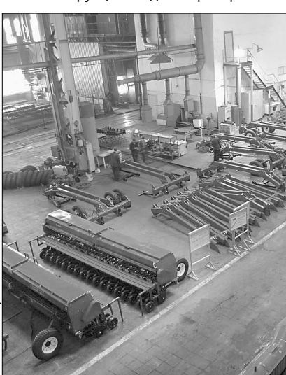
Готовая сельхозтехника ждет своего часа.

Высокий профессионализм от работников СМК требуется неслучайно: на заводе сделаны серьезные заявки на обновление потребности самых динамично развивающихся отраслей рыночного хозяйства.