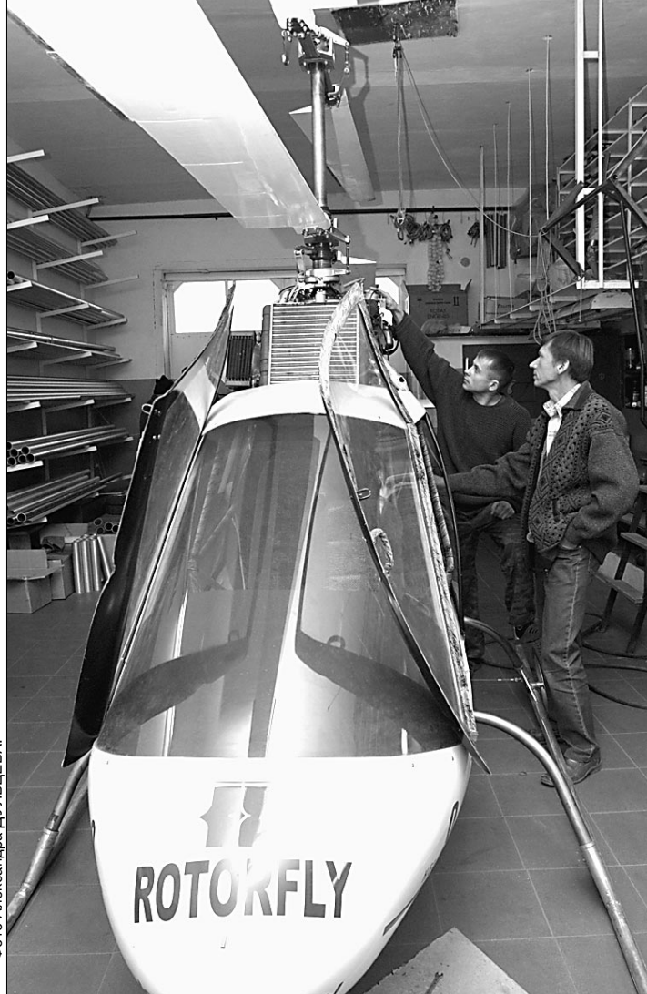
При отказе двигателя или системе управления он может мягко приземлиться не только на аэродром, но и с помощью парашютной системы с пиропатроном.

Безусловно, вертолет по имени «Роторфлай» — высшее достижение самодельных конструкторов, которые могут дать фору любым профессионалам.