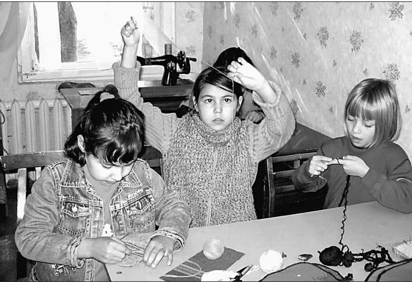
Эти девочки обещают стать хорошими хозяйками.

А еще есть такая проблема в детском доме — мало мужчин среди воспитателей. Как водится, на такую работу идут в основном женщины.