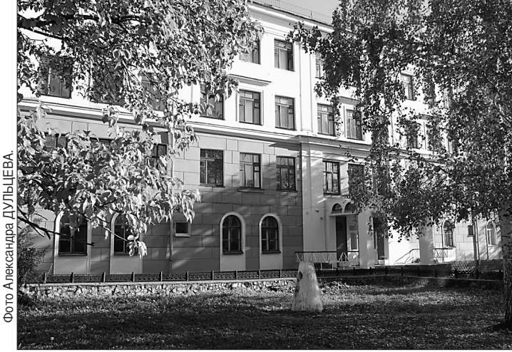
Полвека гимназия № 39 является площадкой педагогического творчества.

В честь полувекового юбилея столичной гимназии состоялся всемирный слёт её выпускников