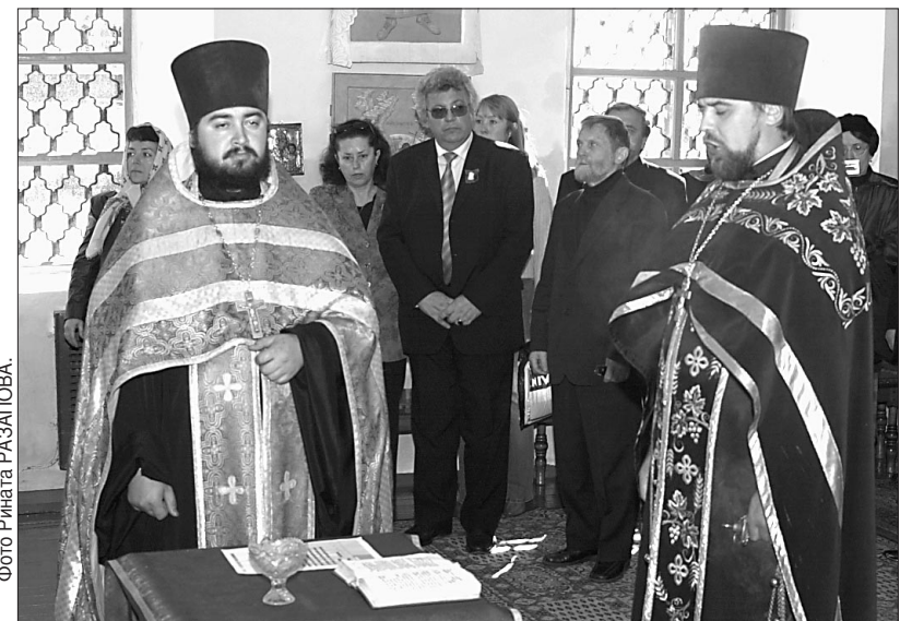
Служба в Дмитриевском храме.

Служба в Дмитриевском храме.