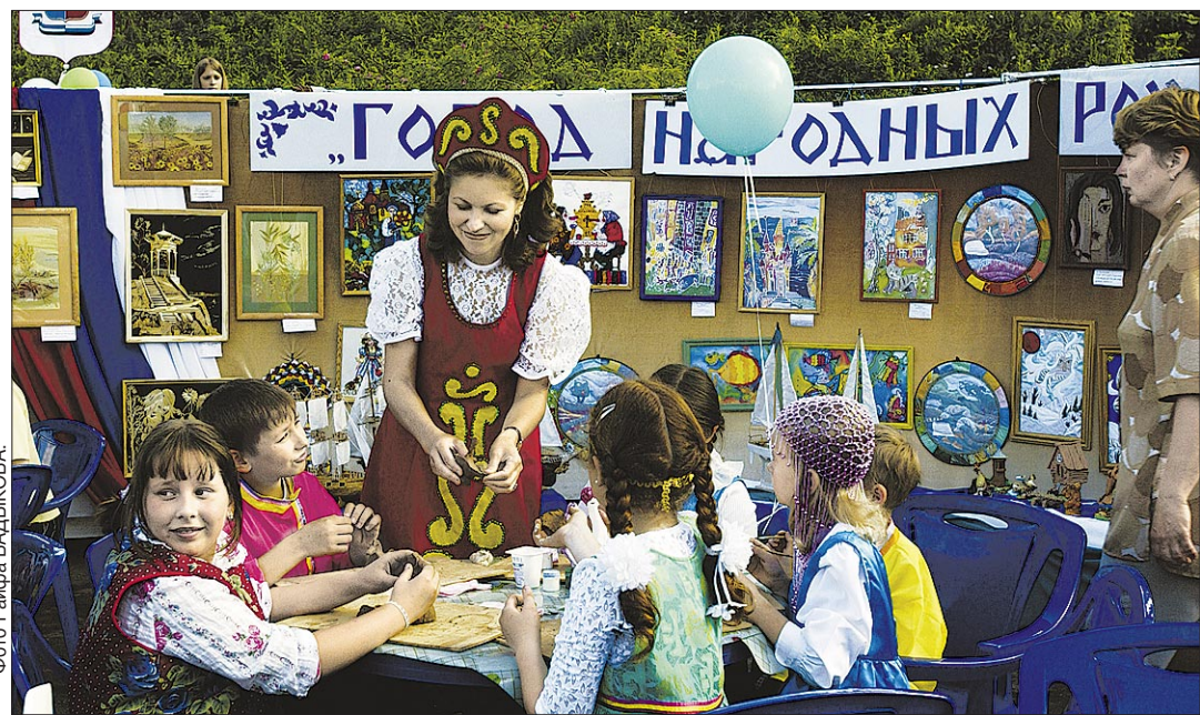
Так рождается красота в умелых детских руках.