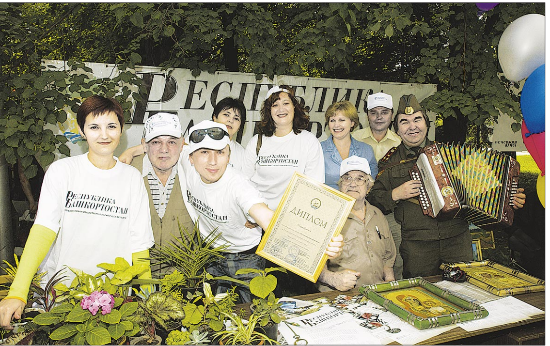
Вместе с нами — герои наших публикаций.

Десятки объективов фотоаппаратов и телекамер без устали фиксируют происходящее, сотни журналистов из самых разных средств массовой информации неотрывно и заинтересованно следят за ходом событий... Нет, господа, это не пресс-конференция с Чубайсом и не приезд в Уфу Жириновского. Пусть они пока поостоятся. Сегодня отмечает свой профессиональный праздник дружная команда работников средств массовой информации, издателей, полиграфистов. 14 июня 1917 года вышел в свет первый номер первой башкирской газеты — «Известия Башкирского областного бюро». Эта дата и стала отмечаться как День работников печати и информации Республики Башкортостан.