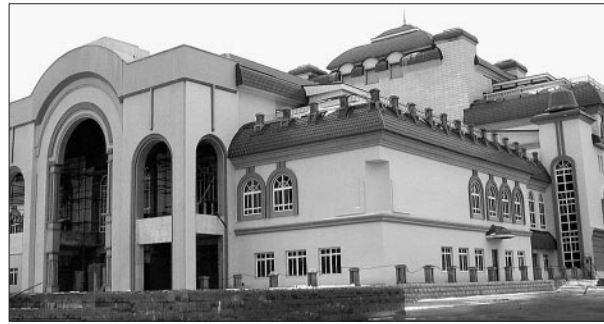
Комплекс зданий театра «Нур» стал украшением Уфы.

Разноуровневая, разноориентированная в зрительном восприятии группа зданий умело и органично объединена. Благодаря этому логичным было поочередный ввод корпусов: первым приняла хозяйев административный корпус (ближе к лесному массиву), потом Малый зал и, наконец, в 2004 году — Большой зал на 500 мест. Кстати, основной зал пришлось по ходу строительства увеличивать почти на сотню мест. Но так как строительство велось практически с листа, переделки не задержали сроков сдачи объекта. Зато за счет этого появилось такое ук-