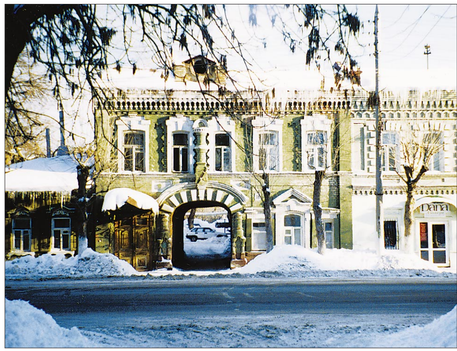
Островок архитектурной старины в современной Уфе.