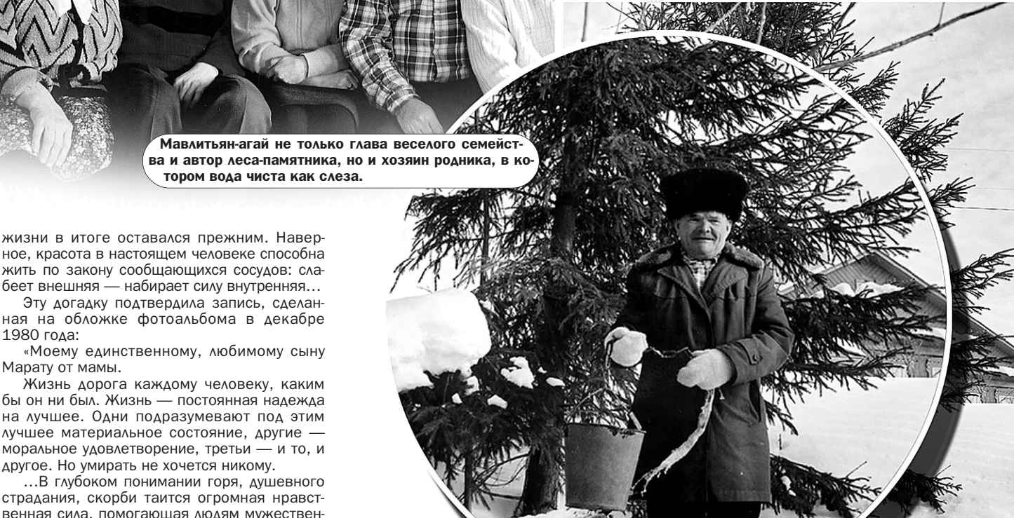
Фото Рината РАГАТОВА, коллаж Станислава НИКОЛЕНКО.